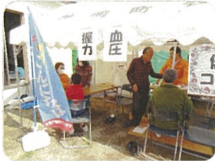
健康チェック・相談