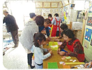
伝承遊び（折り紙・ハルーン）