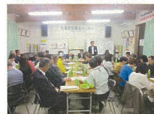
防犯・子供110番の家総会