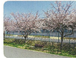
鶴見川土手（木ヶ付ハ-リ）の桜