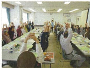
お茶会で手指の運動