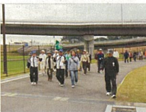
ウォーキング「日産フィル」を歩く