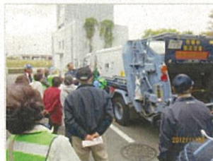
ウォーキング・資源循環局を見学