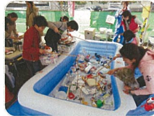
資源ごみの分別ゲーム