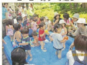
ヨーヨー釣り・水遊び