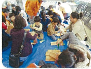
子供の木工教室（踏み台作り）