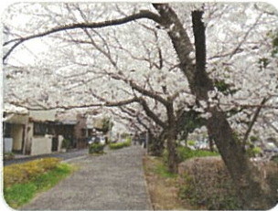
太尾緑道の桜並木