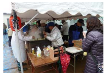
支えあい祭り (焼きそば)