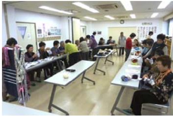
マフラーを指編みで(高齢者部会)