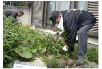
草取り家事支援(太尾ふれあいクラブ)