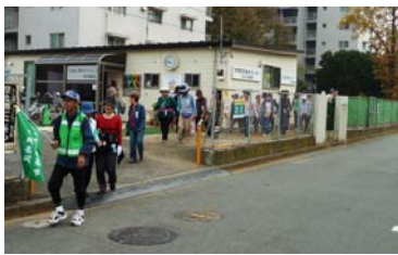
太尾健康ウォーキング(拠点をスタート)