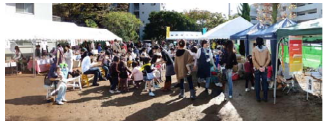
港北区子育て支援拠点による「どろっぷデー」(防犯拠点センターにて)