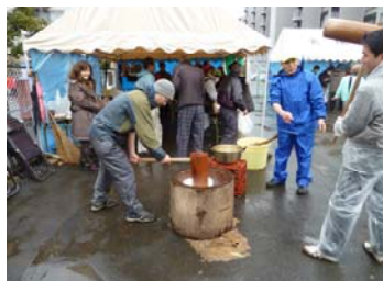
支えあい祭り (雨の中での餅つき)