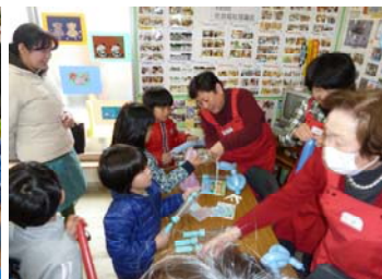
支えあい祭り (折り紙、バルーン)