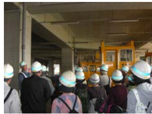
地下鉄 新羽車庫を見学(長距離コース)