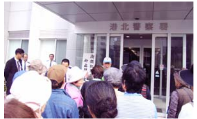
港北警察署を見学(短距離コース)