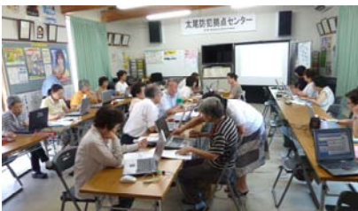
ITサロン (パソコン教室)