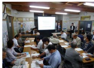
防災キャラバン(防犯拠点センターにて)