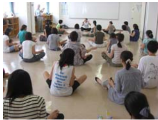
親子でリズム体操(子育て支援部会)