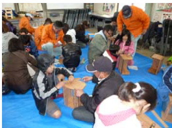
支えあい祭り (子どもの木工教室)