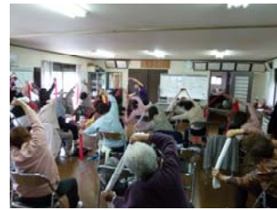
町内会館で健康体操(ボランティア部会)