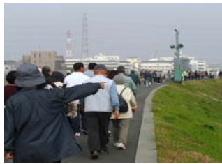
鶴見川土手をウォーキング