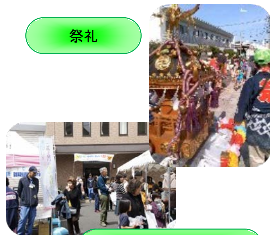
福祉ふれあいまつり