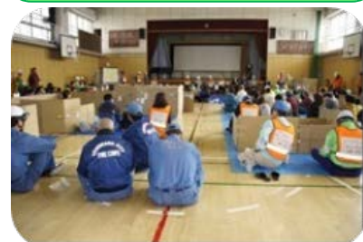
地域防災拠点訓練