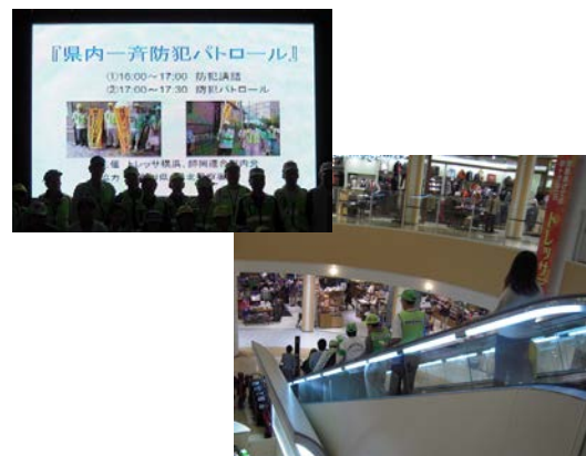
トレッサ横浜での合同パトロール

師岡町には若く新しい住民パワーが育ってきており、新・旧住民の地域のコミュニティーがますます重要です。地域福祉保健活動の推進として「ひっとプラン港北」も3年目に入り、取り組み内容が少しずつ実行に移され定着してきています。「ひろがる・つながる・とどく」の活動をさらに進めていきます。師岡地区の出生率は横浜市でも高率であり、これまでの高齢者福祉とともに子育て世帯の支援にも力をいれていきたいと思えます。