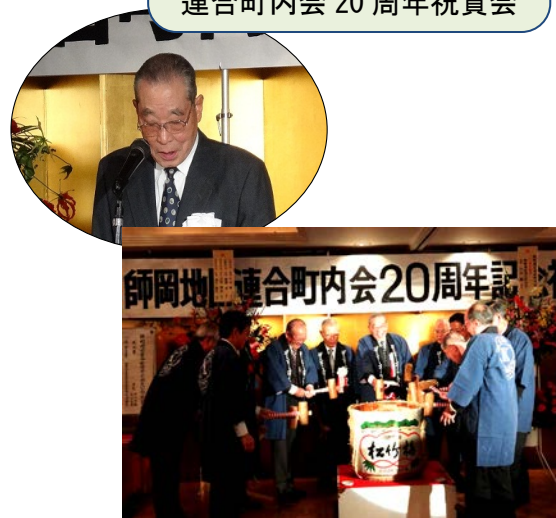
連合町内会 20周年祝賀会