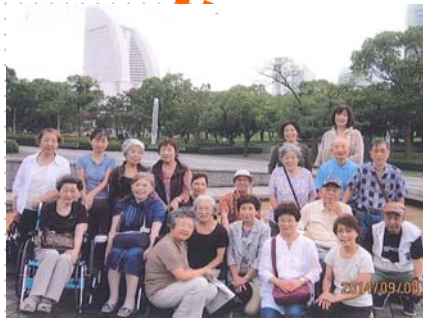
中途障がい者団体いずみ会