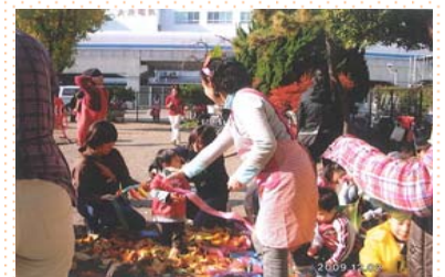
公園遊び 「びよんびよん」