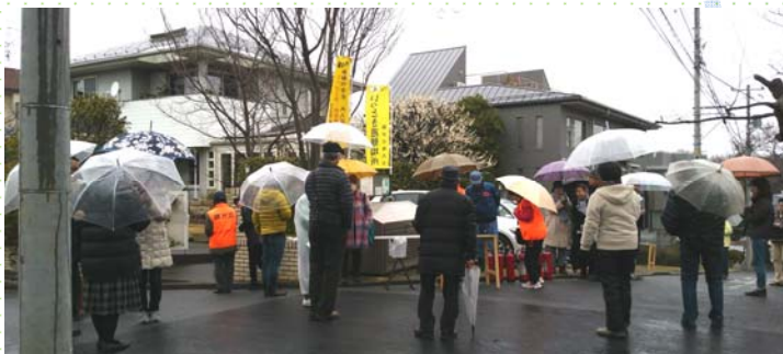
錦が丘町内会防災訓練 (いっとき避難場所への参集と 白布安否確認訓練)