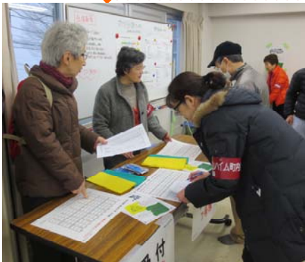
大倉山ハイム自治会 自主防災組織 防災訓練 (防災マニュアルと緑と黄色のバナー運用訓練)