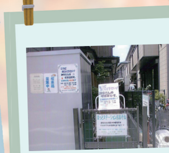
ほっとステーション おおそね