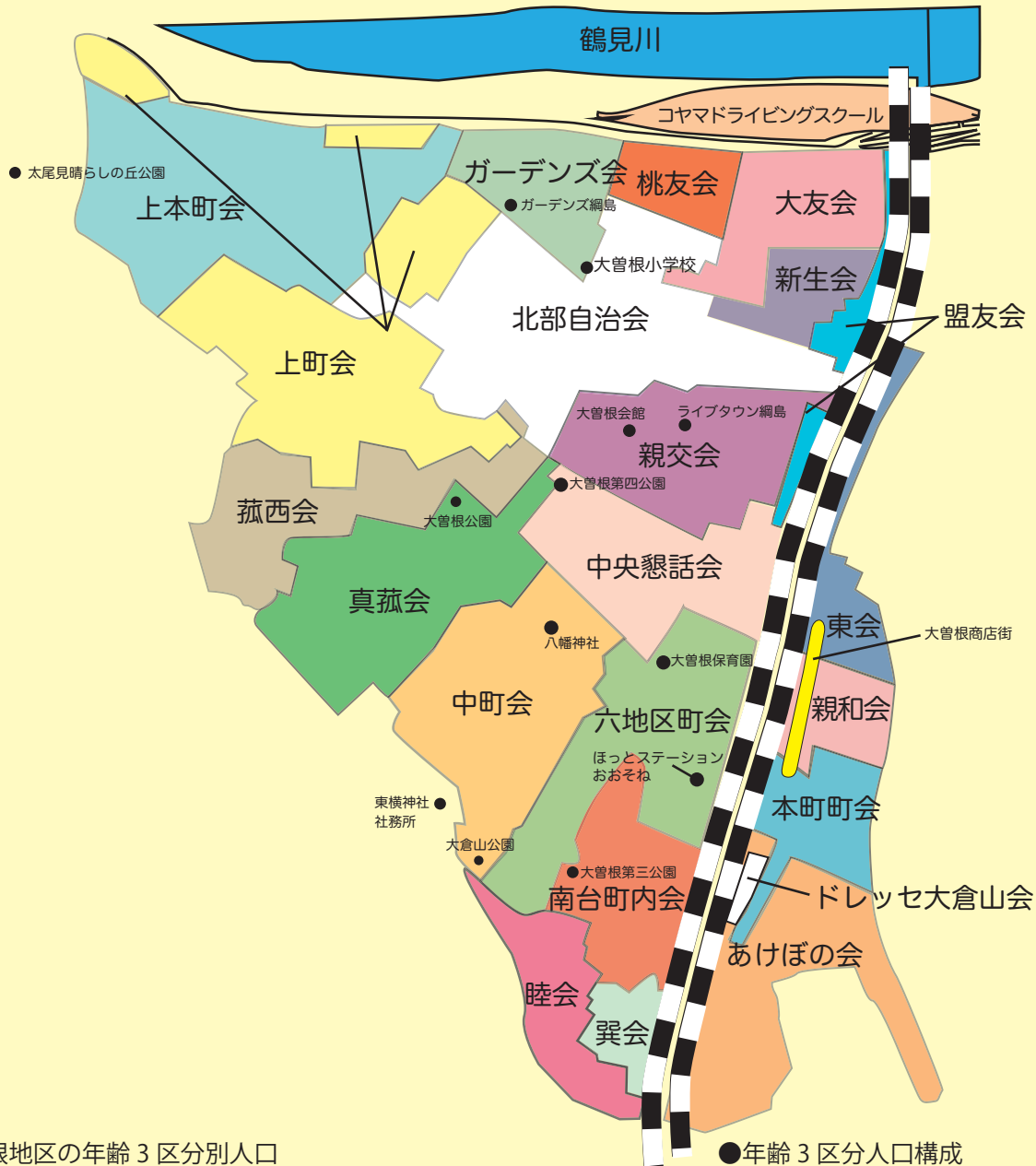
●大曽根地区の年齢3区分別人口