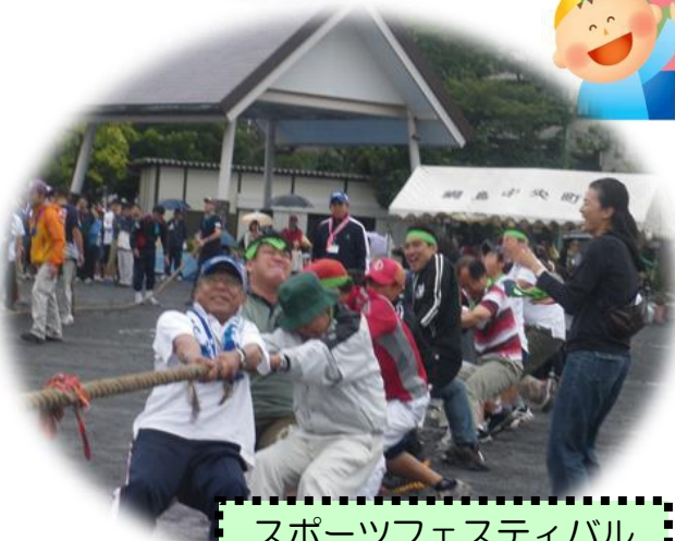
スポーツフェスティバル