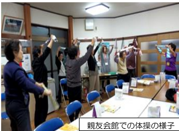
親友会館での体操の様子

各自治会・町内会で取り組む災害時要援護者支援について、現在の状況や工夫していることなどを情報交換しました。あわせて、いくつかの取り組みを「ひっとプランニュース」で地域の皆様に紹介しています。