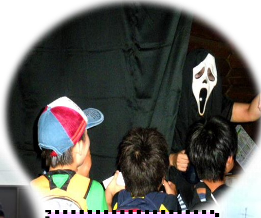
わんぱくおばけ大会