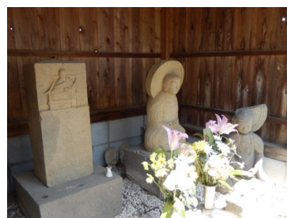
東林寺横の木食観正碑と阿弥陀如来像