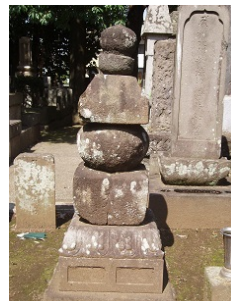
三會寺印融法印の墓