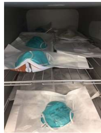
図 2：ロード用の N95 マスクの包装と棚への積載例