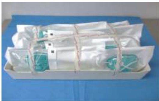
図 1：ロード用の N95 マスクの包装とトレイへの積載例