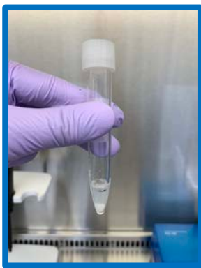
泡が少ない 十分量採取されている