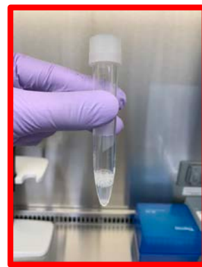
泡が多い 十分量採取されていない