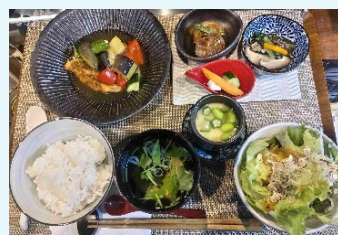
WABISUKE 魚の膳(ランチメニュー)