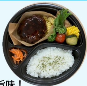
肉の旨味! こだわりのハンバーグ弁当