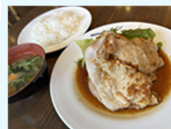
しょうが焼き(中盛ライス)