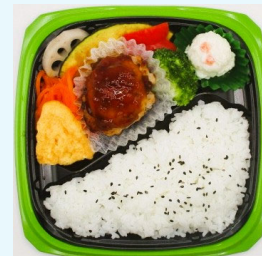
ハマの元気ごはん弁当