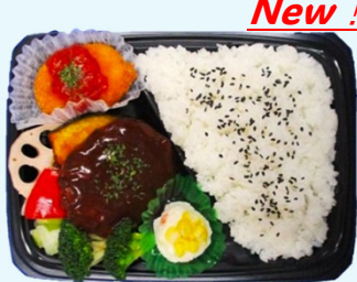
ハマの元気ごはん弁当