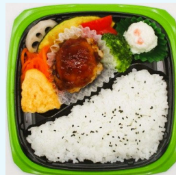
ハマの元気ごはん弁当