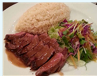
ステーキ ガーリックライス