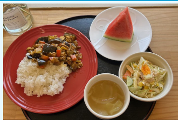
ごろごろ野菜のスパイシーカレー