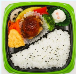
ハマの元気ごはん弁当