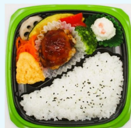
ハマの元気ごはん弁当