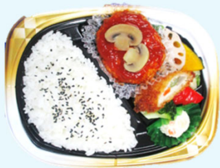
ハマの元気ごはん弁当