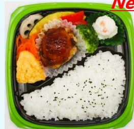
ハマの元気ごはん弁当