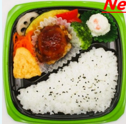
ハマの元気ごはん弁当