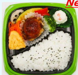
ハマの元気ごはん弁当