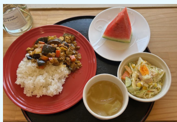
ごろごろ野菜のスパイシーカレー