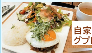
自家製ハンバー グプレート L-B