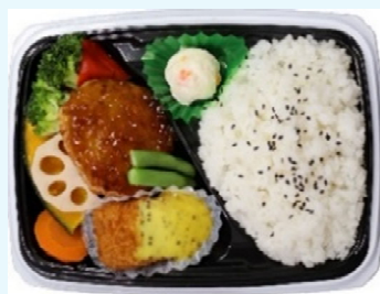
ハマの元気ごはん弁当