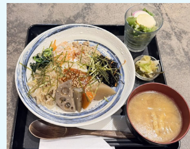
和風ビビンバ丼(ランチメニュー)