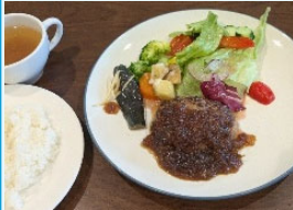
ランチメニュー 手ごねハンバー グ和風ース L-B