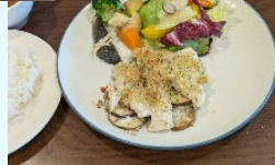
ランチメニュー メカジキ香草 オープン焼き R-C