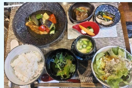
WABISUKE 魚の膳(ランチメニュー)