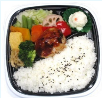
ハマの元気ごはん弁当