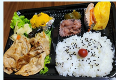
日替わり弁当(メニュー例)