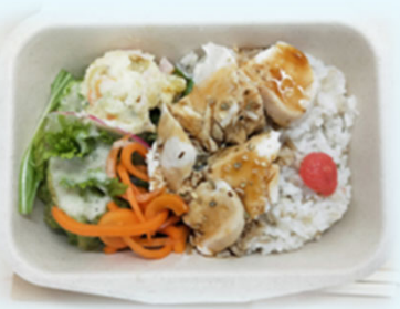
蒸し鶏とサラダのお弁当