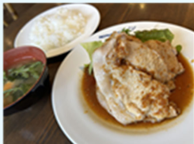
しょうが焼き(中盛ライス)