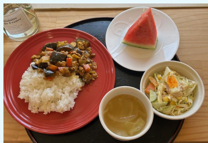
ごごろ野菜のスパイシーカレー