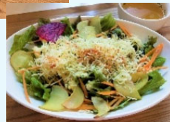
野菜たっぷり タコライスL-C