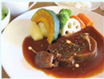
牛たんシチューセット