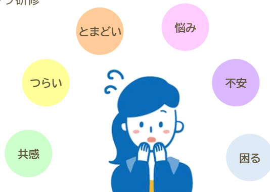
「とまどい」とどう向き合っていくのか

おおむね復職後2年以内で横浜市内の 医療機関等に勤務している看護職(各回)10名 ※定員になり次第締切とします。