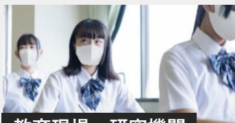
教育現場・研究機関

お客様訪問がある接客クルーやどうしても出社せざるを得ない職場でも、安心して働けることを目指します。