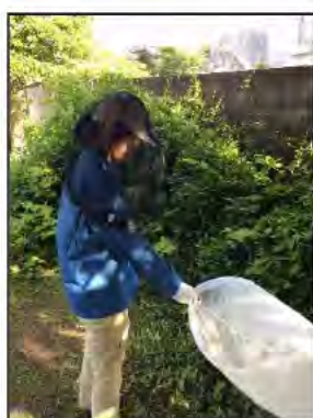
写真2 ひとつり 人囮法 (スウィーピング法)