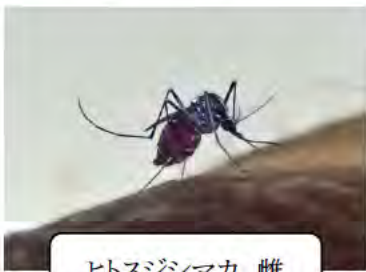
ヒトスジシマカ 雌

その他の蚊媒介感染症ウイルス検査結果については、衛生研究所ホームページに掲載する予定です。