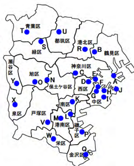
図1 蚊成虫捕獲調査地点