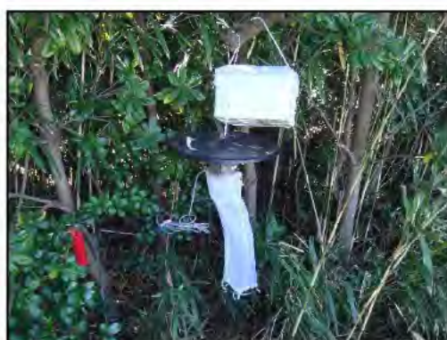
写真1 CDC型ライトトラップ

捕獲された蚊は調査場所ごとに種類を同定し、雌成虫については、ウイルス検査担当に供出しました。今回は、市内における蚊成虫生息状況調査結果について報告します。