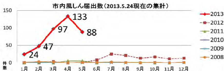
平成25年 週一月日対照表