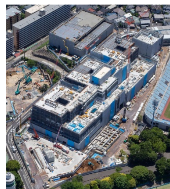
工事現場の様子(令和元年6月17日撮影)

診療棟は平成29年9月に、管理棟は平成30年11月に建設工事に着手し、令和2年1月末に完成する予定です。並行して、医療機器等の整備や病院総合情報システムの構築、運用計画の策定など、必要な準備を進めており、令和2年5月1日に開院する予定です。