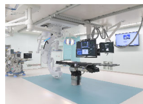
【ハイブリッド手術室】