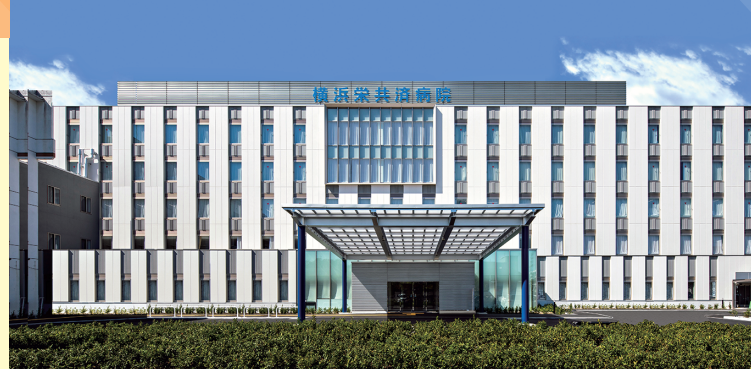
国家公務員共済組合連合会 横浜栄共済病院 横浜市栄区桂町132番地