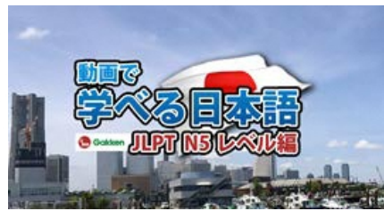
eラーニング (ベトナム語版の提供)