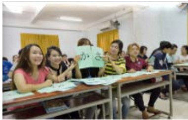
Gakken の教育プログラムを提供 (日本語や介護の学習教材)