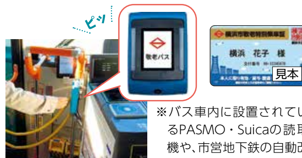
専用の読取機と取付位置のイメージ

※バス車内に設置されているPASMO・Suicaの読取機や、市営地下鉄の自動改札機では使用できません。