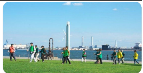
(ノルディックウォークの様子)

横浜市老人クラブ連合会では、老人クラブのイメージアップを図るとともに、横浜らしさ、健康で明るく元気な高齢者を連想する「愛称」を決めました。様々な老人クラブ活動を通じて、市民の皆様に関心を持っていただきたいと思います。