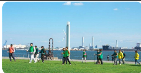
(ノルディックウォークの様子)

横浜市老人クラブ連合会では、老人クラブのイメージアップを図るとともに、横浜らしさ、健康で明るく元気な高齢者を連想する「愛称」を決めました。様々な老人クラブ活動を通じて、市民の皆様に親しんでいただきたいと考えております。