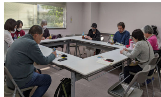
▲初回打合せの様子