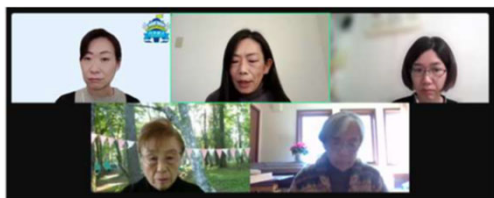
▲オンライン面談の様子