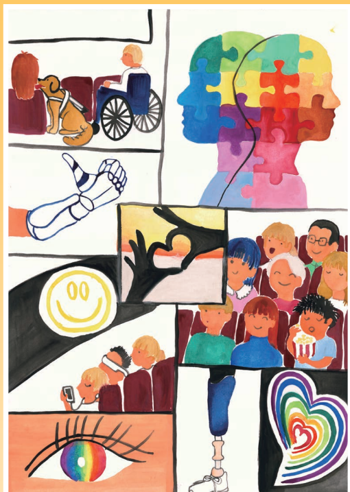
誰でも楽しめる空間を