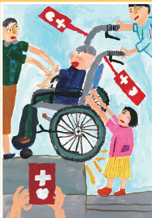
お年よりを助けよう