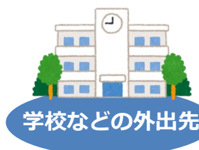
学校などの外出先