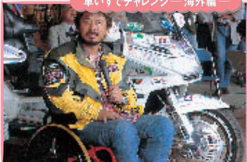
車いすでチャレンジ—海外編—