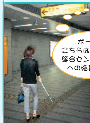
ポーン, こちらは健康福祉総合センター方面への階段です。