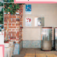
民間施設のバリアフリー化