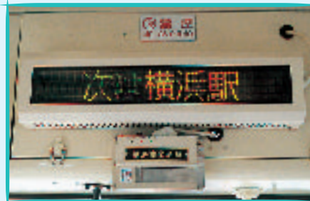
バス内の文字標示 (聴覚障害者に対応した情報提供)