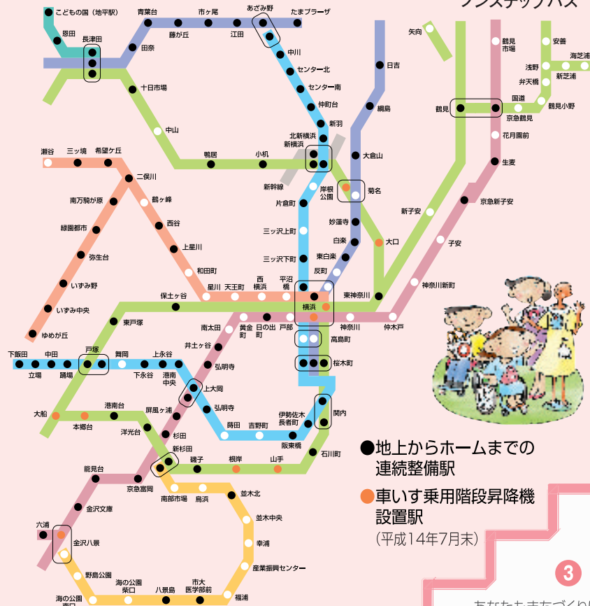
ノンステップバス