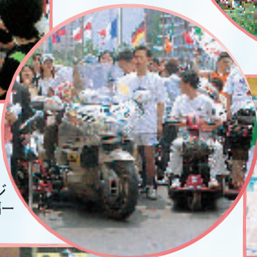
車いすで チャレンジ —海外編—