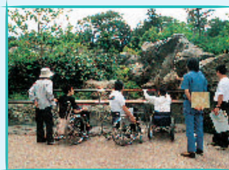
ズーラシア開園前に行われた障害者団体等の見学会 市では, 施設を整備するときには, 障害者や高齢者など利用者の意見をきいています。