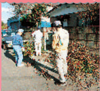
ボランティアサークル「鶴の恩返し」