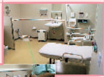
人工肛門等の使用者(オストメイト)にも対応した多目的トイレ