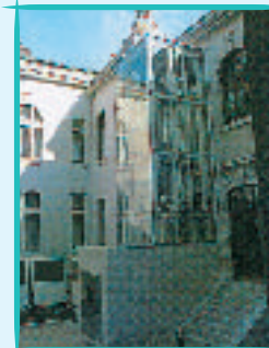
開港記念会館にエレベーターを設置 (既存施設の整備促進)