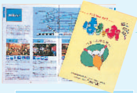
「はまっぷ」(右)と「はまっぷホームページ」(左)

市民による実行委員会で, バリアフリーガイドマップを作成し, 市民グループがインターネットとi-modeで情報提供を行っています。