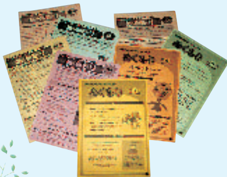
関内駅周辺福祉のまちづくり通信「ぬくもり」