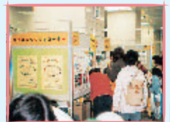
重点推進地区 (磯子)