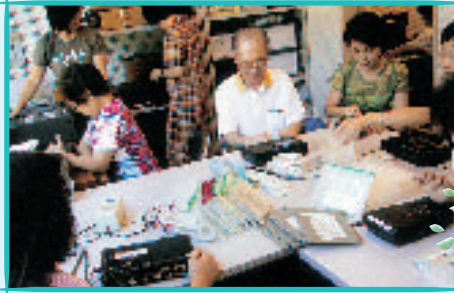
「かもめ」視覚障害者用情報パックの作成 市民グループが視覚障害者向けに地域情報をまとめた音声情報を配付しています。

市民による実行委員会で, バリアフリーガイドマップを作成し, 市民グループがインターネットとi-modeで情報提供を行っています。