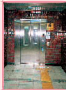
駅のエレベーター (地下鉄関内駅など)