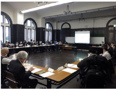
区部会での意見交換の様子