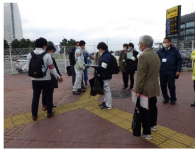
107名が参加した まちあるき点検