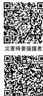
災害時要援護者支援ガイド

障害のある人や高齢者など、自力での避難が困難な方の円滑な避難支援のため、地域住民や関係機関と連携しながら、平時からの備えと災害時の共助体制の構築を促進しています。その一環として、災害時要援護者本人と家族及び支援者の取組のポイントをまとめた「災害時要援護者支援ガイド」や、地域で支え合う体制づくりのポイント、避難支援や安否確認の具体的な取組などを整理した「共助による災害時要援護者支援の手引き」を作成しています。