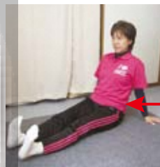
足首の曲げ伸ばし

じっとしていると足腰の血行が悪くなり、疲労や腰痛、むくみや冷えにつながります。意識して脚の血流改善を積極的に行いましょう!