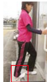
アキレス腱伸ばし