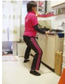
ハーフスクワット