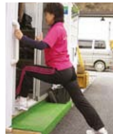
股関節とふくらはぎ