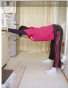
肩と太もも裏のばし