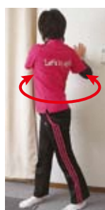
上体ひねり(左右・斜め上)