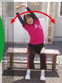
背伸び・体側伸ばし