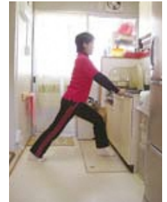
ふくらはぎ伸ばし