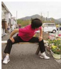
内ももと背中伸ばし