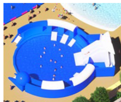
<アトラクションプール>