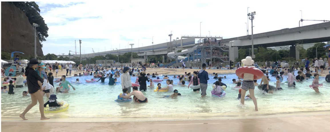
<流水プール（手前が渚プール）>

メインとなる流水プールにはウォータースライダーのほか、かつての海水浴場をイメージした渚状のアプローチ（渚プール）を設けました。