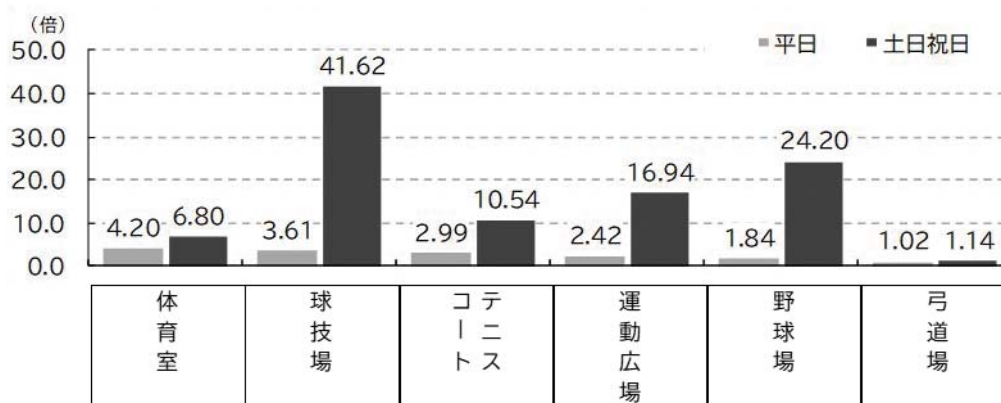
図表 17 スポーツ施設の室場別平均抽選倍率

※抽出した施設の結果であり、全施設を対象としたものではない