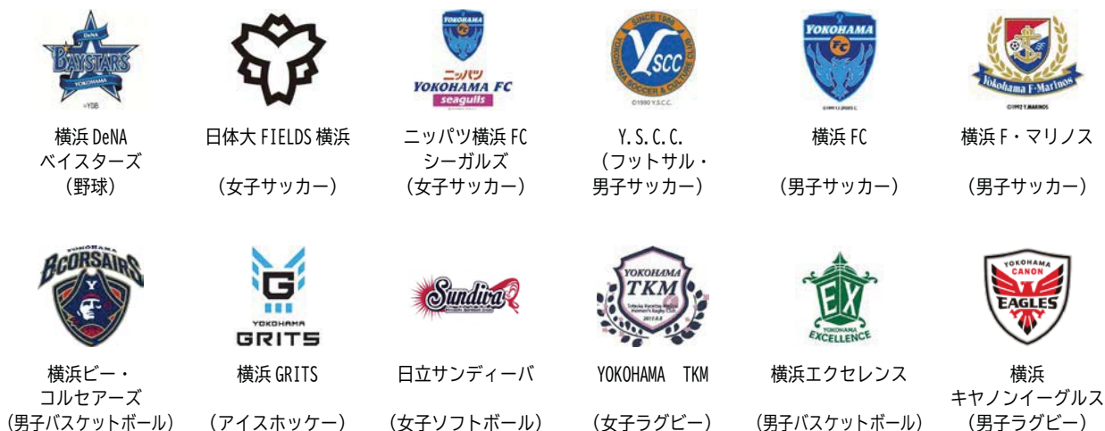
図表 21 横浜スポーツパートナーズにおいて連携・協働するチーム