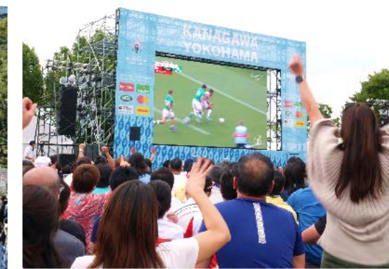
ラグビーワールドカップ2019™ファンゾーン