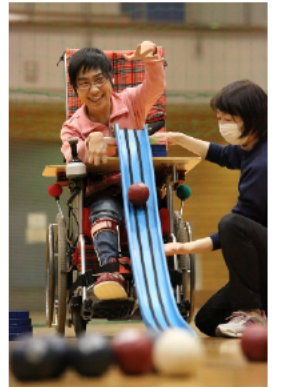
横浜市障害者スポーツ大会(ハマビック)