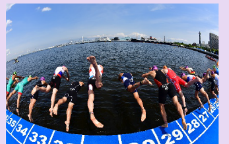
ワールドトライアスロンシリーズ横浜大会

関内・関外地区について、居心地が良く歩きたくなる空間を目指し、社会実験の結果を踏まえた道路や公共空間の整備を進めます。また、スポーツイベントと絡めた取組を行い、周知します。