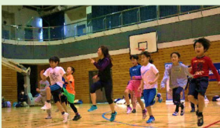
キッズトライアスロン教室

学校や地域にスポーツ指導者を派遣し、スポーツ教室の事業等を行います。部活動指導員の配置は引き続き進め、地域移行の可能性も含めて検討するなど、部活動を持続可能なものとするための取組を進めます。小学校及び中学校の学校施設においては、計画的かつ効果的な施設の保全や空調設備の整備を進めます。