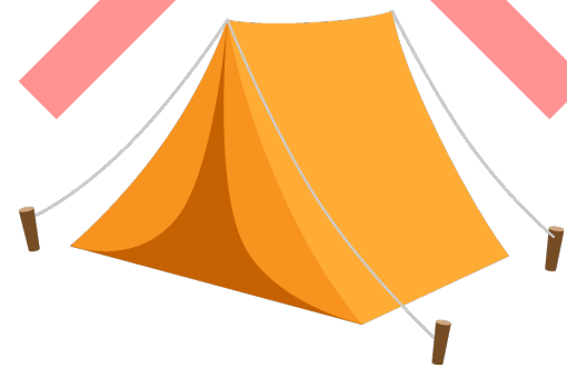
ペグ（杭）を用いるテント 大型（ 2\text{m} \times 2\text{m} を超える）テント