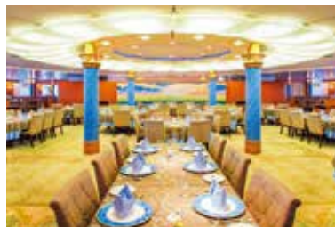
メインダイニング「瑞穂」