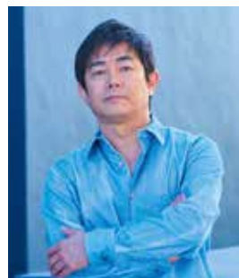
宮沢 和史 コンサート