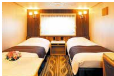
スーベリアルーム 客室イメージ

※コンフォートステートルームを3名さま1室でご利用の場合、ブルマンベッド利用となります。