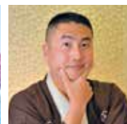
三遊亭 歌奴 落語