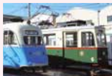
市内を走る路面電車「とさでん」