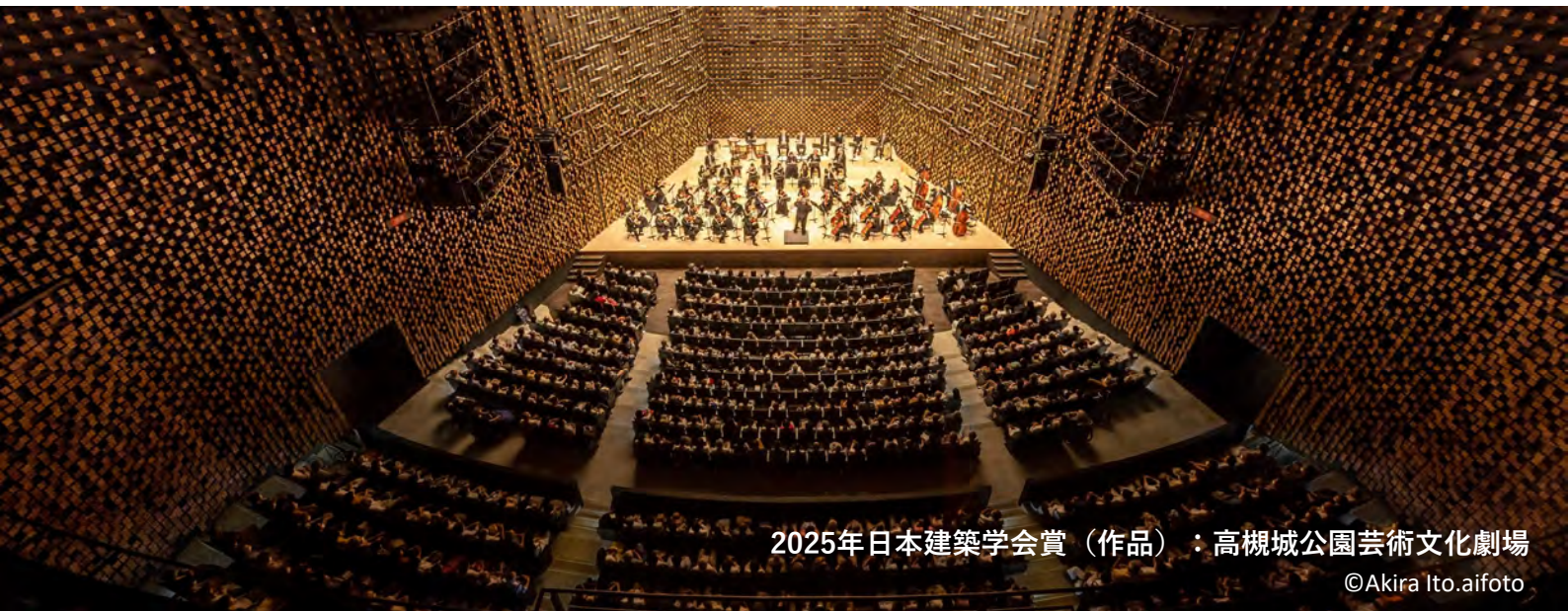
2025年日本建築学会賞（作品）：高槻城公園芸術文化劇場