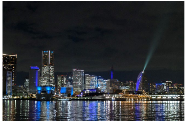
GUNDAM-LABの2階デッキからの「NIGHT VIEWING」