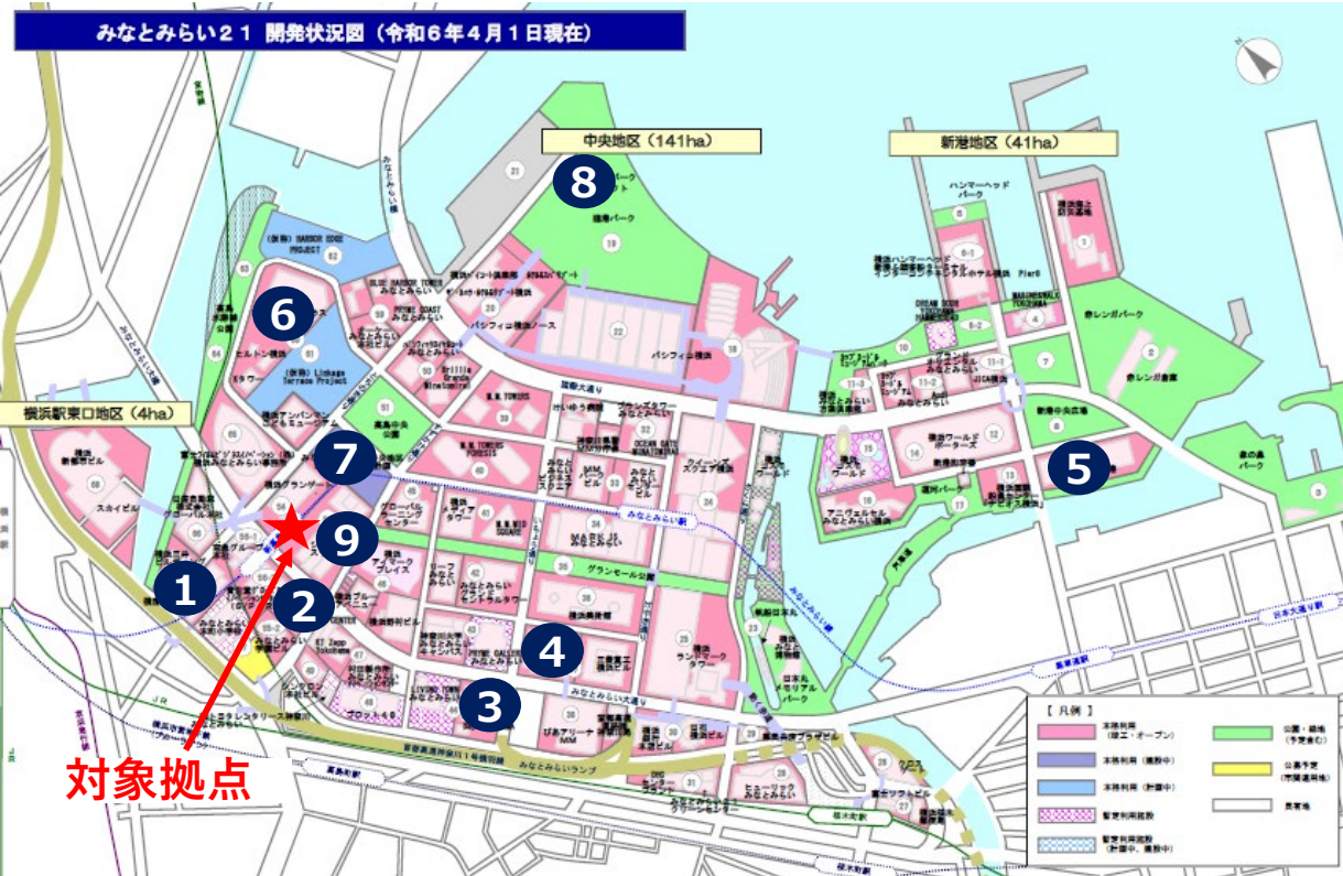
みなとみらい21 開発状況図 (令和6年4月1日現在)

みなとみらい21地区は、高密度の企業・商業施設が集積し、国際会議等も可能な高機能の文化・観光・コンベンション施設や宿泊施設も立地する国際交流拠点です。開港都市としての歴史的遺産や、地区内に集積した文化・音楽施設などを生かしながら、都市型の文化が生まれる環境を形成しています。