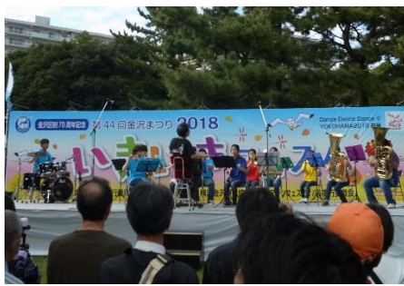
<金沢まつり いきいきフェスタ>