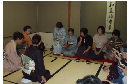
<2月の土日祝日を中心に、15の地域活動団体等が日替りでイベントを開催>