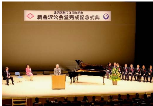
<横井実行委員長のご挨拶>