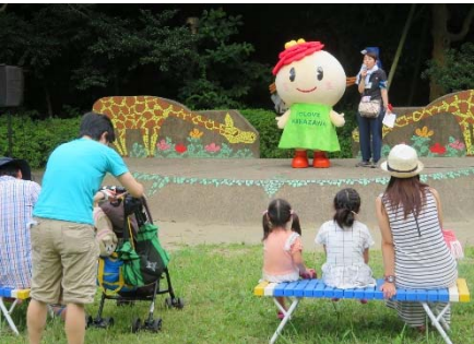
<金沢動物園の文化祭>

(2) 5 月～3 月 地域活動団体・企業・大学等による 70 周年記念事業 …… 約 80 事業 区役所主催・共催の 70 周年記念事業 (区民まつり等) …… 約 20 事業