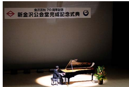
<2/2 記念式典ミニコンサート>