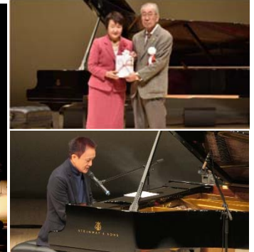
<上: 寄贈式 下: 小田和正氏>