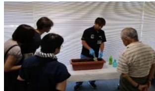
土壌混合法講習会の様子

新たに保育園や小学校で土壌混合法の体験学習や、商業施設等の人の多く集まる場所での土壌混合法の実演などを行います。