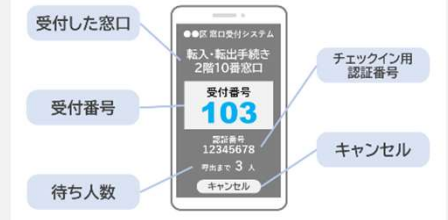
スマートフォン画面イメージ