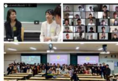
ライフデザインセミナー（イメージ）

また、子育て中の家庭との交流を通じ、実際の生活の様子等を知ることができる機会を提供します。