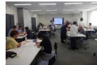
ブロック連絡会の様子

自助・共助の取組強化のため、自治会町内会等による発電機等の資機材の購入等を支援するとともに、防災講演会を開催します。