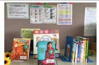
【話題本の展示コーナー】

弊社の書店運営のノウハウを活かし、地区センター内の図書室の蔵書を充実させ、話題本コーナー等展示のコーナーを新設します。また、「地区センターだより」で新着図書や本の紹介を掲載します。