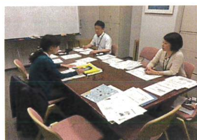
【会計報告会の様子】