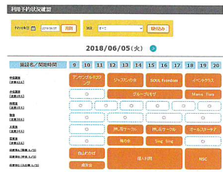
【施設予約システム画面】

例：料理室利用増 620 円 × 1 コマ利用 (毎月 2 回増加) = 620 円 × 24 回 = 14,880 円