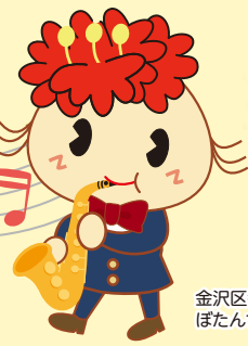
金沢区幸せお届け大使 ぼたんちゃん