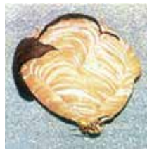
キロスズメバチの初期巣