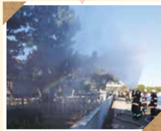
「旧伊藤博文金沢別邸」 消防訓練