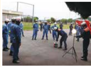
携帯発電投光器の取扱操作