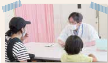
歯科医師が個別に対応します