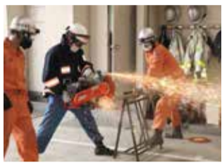
エンジンカッターの取扱操作