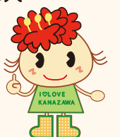
金沢区幸せお届け大使 ぼたんちゃん