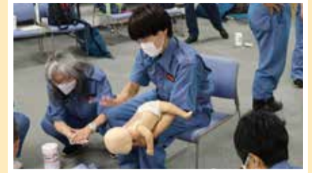
乳児に対する気道異物除去