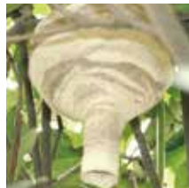
コガタスズメバチの初期巣