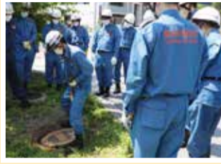
消火栓の開閉要領