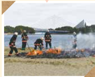
どんど焼きの警戒活動