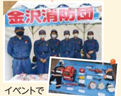
イベントで 広報活動