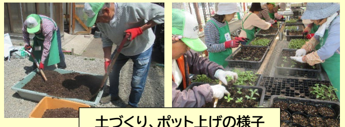
土づくり、ポット上げの様子

4月21日から公園ボランティアの会の皆さんと種まき・ポット上げの育苗事業を始めました。花苗はマリーゴールド、サルビア、ジニア、センニチコウの4種類。日々の水やりなどを当番制で行い、公園愛護会へは6月13日に配付しました。皆さんの公園で大切に育てていただけると嬉しいです。