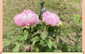
能見台清水ヶ入公園