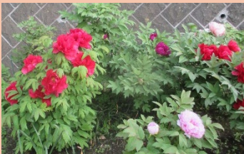
釜利谷東八丁目公園