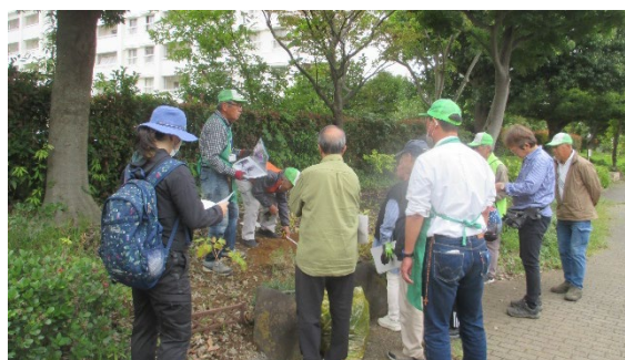
皆さん熱心に受講されました