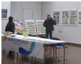
昨年のパネル展の様子

令和8年2月2日(月)13:00~14日(土)15:30 まで区役所2階区民ギャラリーにて開催します。皆さま是非お立ち寄りください。