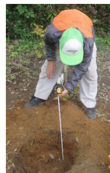
大きい穴を掘ります