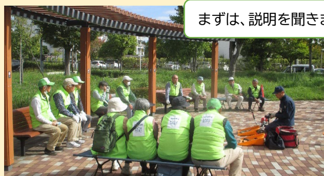
まずは、説明を聞きます

令和7年 10 月 28 日、並木イオン向かいの中藻公園で、草刈機安全講習を開催。近隣の公園愛護会とボランティアの会から計 11 名が参加。カルマーの使い方とお手入れ方法を学びました。