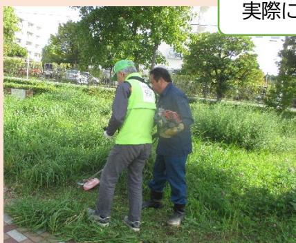
実際に草を刈ります