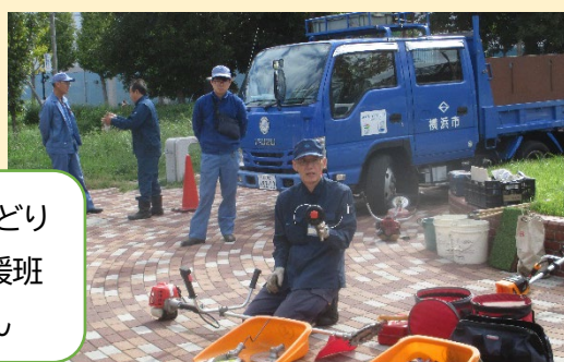
講師は、みどり 環境局支援班 の皆さん