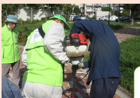
持ち方にもコツ がいります