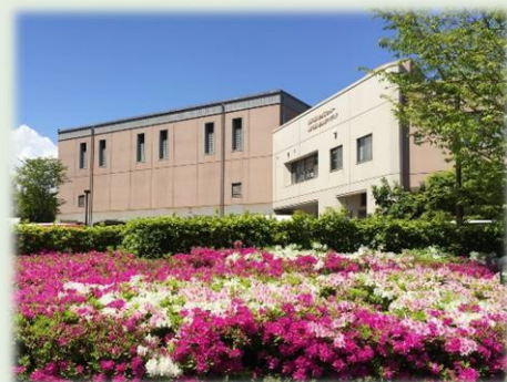
能見台地区センター 金沢区能見台東2-1