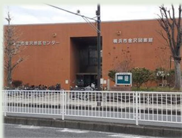
金沢地区センター